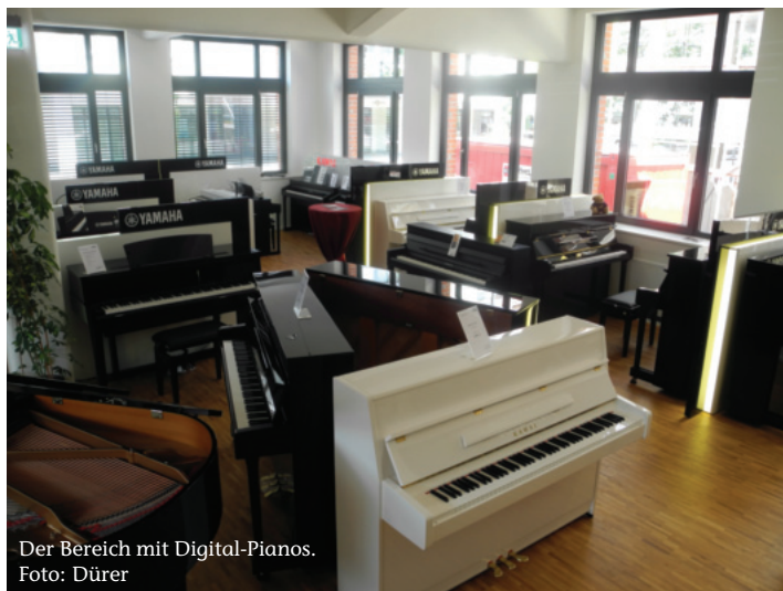
Der Bereich mit Digital-Pianos.

Geht man in die untere Ebene des Gebäudes, dann erkennt man, dass die Werkstatt zwar Kunst-Licht benötigt, aber dennoch nicht ohne Tageslicht auskommen muss, denn die halbhohen Fenster lassen immer noch eine gute Portion Tageslicht in die Räume fließen. Hier sind die Mitarbeiter zu einem Großteil ihrer Zeit beschäftigt mit Service-Arbeiten an Instrumenten, die weit über das Stimmen hinausgehen.