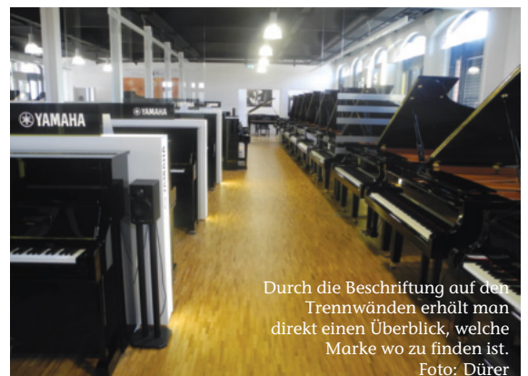
Durch die Beschriftung auf den Trennwänden erhält man direkt einen Überblick, welche Marke wo zu finden ist.

Doch die Ausstellungsfläche mit einem kleinen Besprechungsraum, mit einer Empfangstheke und einem kleinen Intoniererraum ist nur ein Teil des