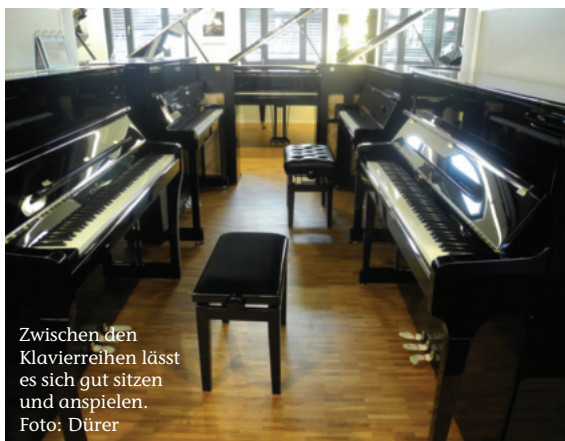
Zwischen den Klavierreihen lässt es sich gut sitzen und anspielen.

Das Kerngeschäft teilt sich auf zwischen den Marken Schimmel, Yamaha und Kawai. „Es gab immer noch Jahre, in denen eine Marke immer stärker war als die andere.“