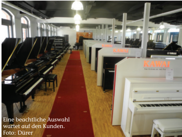
Eine beachtliche Auswahl wartet auf den Kunden.

Das Gebäude, in dem sich nun seit Juni 2015 das Fachgeschäft Hölzle präsentiert, hat eine wirklich umfangreiche Geschichte. 1903 wurde es als Strumpfwaren-Fabrik gebaut. In den 30er Jahren wurde das Gebäude sogar durch einen Erweiterungsanbau vergrößert, was man heute nur mehr an den eckigen Fenstern erkennt, während die im ehemaligen Teil noch Rundbögen aufweisen. Danach übernahm Hollerith Deutschland das Gebäude, ein Unternehmen, das als Vorgänger von IBM Lochkarten-Computer baute. Und diese Lochkarten sind in Sindelfingen gedruckt worden. Bis in die 90er Jahre des 20. Jahrhunderts war das Gebäude dann im Besitz von IBM. Danach wurde es zu einem Museum der IBM-Geschichte. „Allerdings war das Gebäude damals recht unscheinbar, denn die Fassade war weiß getüncht und rundherum war ein