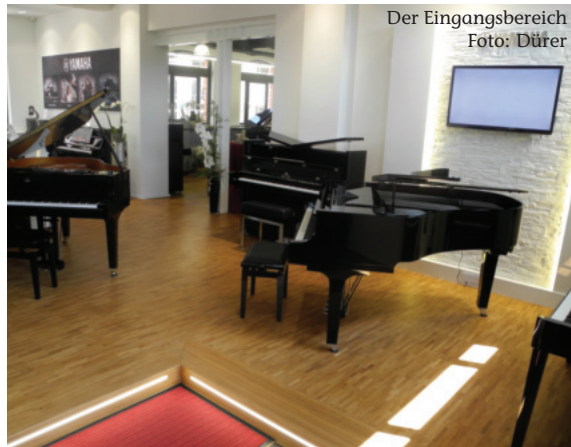
Der Eingangsbereich Foto: Dürer

einigen Überlegungen und zwei weiteren Jahren nahm er zusätzlich zu Yamaha auch Kawai als Vertretungsmarke hinzu. Allerdings zog er zu dieser Zeit wieder um mit dem Klavierfachgeschäft: